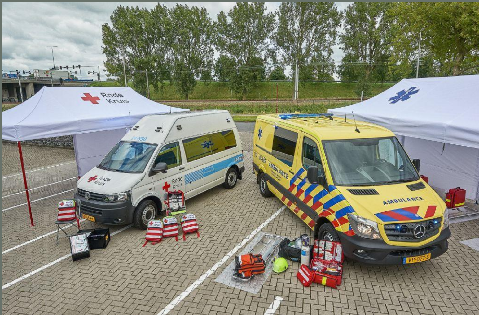
OTO LIMBURG VOORBEREIDING OP RAMPEN EN CRISES